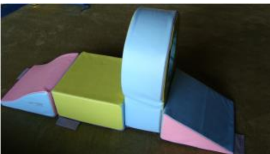
Parcours 4 blocs É Mot 07