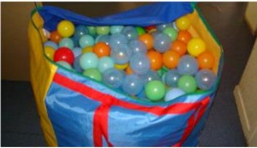
Sac à balles