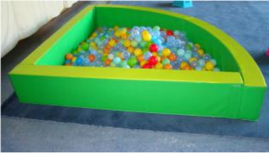
Piscine à balle