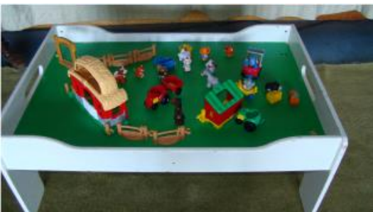
Table de jeux