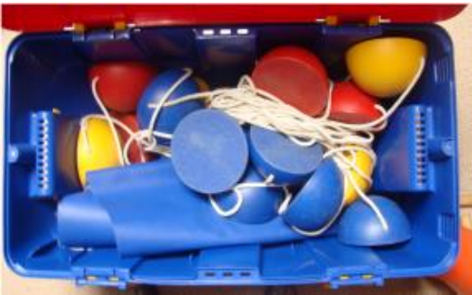
Malle échasses rondes