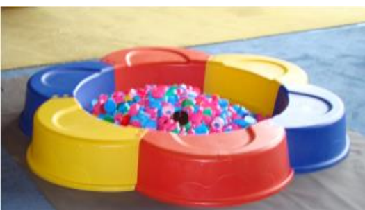
Malle à bouchons