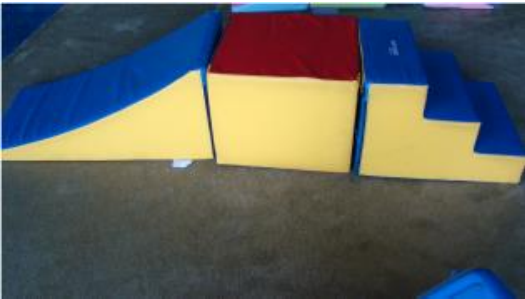
Parcours 3 blocs