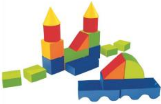
Gros blocs de construction